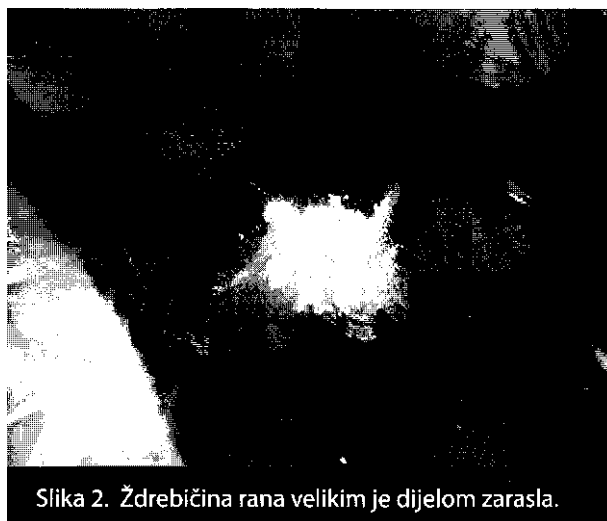
Slika 2. Ždrebičina rana velikim je dijelom zarasla.

«Svakodnevno je mijenjala zavoj, a ja sam nekoliko puta dnevno vlažila zavoj ionskim srebrom. Obje nas je začudila brzina kojom je rana zarastala. Umjesto da zarasta mjesecima, ovaj joj je put trebalo 16 dana.»